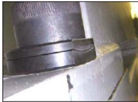
Rysunek 2: Kontrola śruby/podkładki przeciwwagi