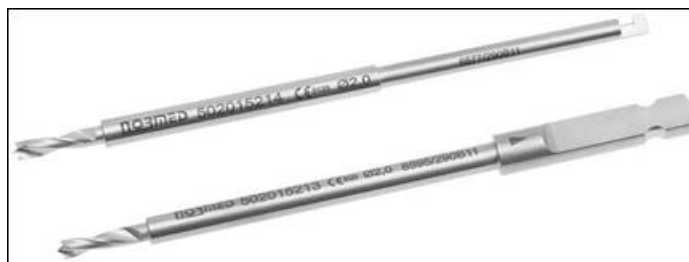
Zdjęcie 2: Widok wiertel