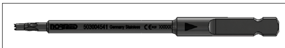
Zdjęcie 1: Widok nawiertaka do śrub z końcówką AO

Wyprodukowane przez firmę Normed Medizin Technik GmbH (jak wskazano w Załączniku 2)