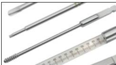
Zdjęcie 3: Widok gwintu

Firma Zimmer Biomet wprowadza Notatkę bezpieczeństwa (wycofanie) dla konkretnych instrumentów produkowanych wcześniej i oznaczonych jako wyprodukowane przez firmę Normed Medizin Technik GmbH jak określono w załączniku 2. Akcją terenową objęte są wszystkie partie produkowane przez tę firmę. Usuwane są tylko instrumenty oznaczone nazwą/logo „Normed”. Potencjalnie produkty, których dotyczy zawiadomienie, można rozpoznać zgodnie z załącznikiem 1 (bezpośrednio na oznakowaniu niesterylnych narzędzi lub na etykietach sterylnych narzędzi). W przypadku jakichkolwiek problemów związane z właściwą identyfikacją instrumentów, których może dotyczyć zawiadomienie, należy skontaktować się z przedstawicielem firmy Zimmer Biomet w celu uzyskania pomocy.