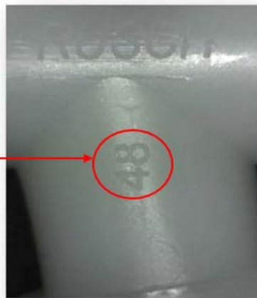
Rysunek 2 – Numer identyfikacyjny