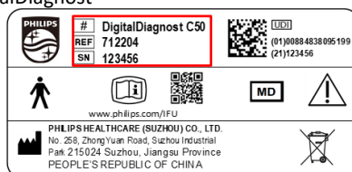
Ilustracja 2: Przykładowy model i numery seryjne systemu DigitalDiagnost

Listę modeli urządzenia, których dotyczy problem, a także ich numery seryjne można znaleźć w Dodatku B. W celu ustalenia, czy opisywany problem dotyczy Państwa produktu, należy sprawdzić etykietę umieszczoną na systemie (patrz ilustracja 2).