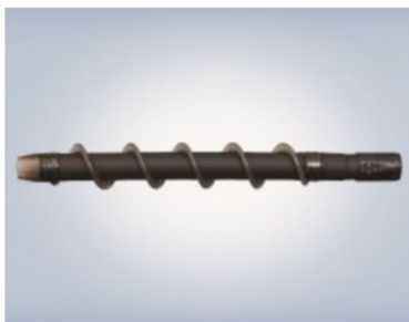
RURKA POWERSPIRAL DPST-1