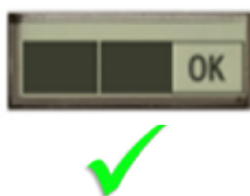
Rysunek 2 Urządzenie jest gotowe do użycia

Jeżeli na wskaźniku stanu wyświetli się „OK”, można dalej korzystać z urządzenia (rys. 2). Jeżeli jednak na wskaźniku stanu wyświetli się symbol klucza płaskiego, nie wolno dalej korzystać z urządzenia (rys. 3).