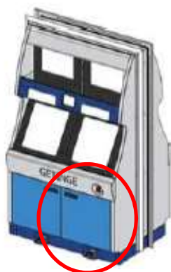
GETINGE ED-FLOW AER