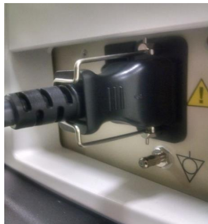
Lokalizacja kabla zasilającego z tyłu urządzenia.

Jeśli koniec kabla zasilającego od strony systemu (zdjęcie poniżej) jest uszkodzony, należy zaprzestać używania systemu do momentu wymiany przewodu. Jeśli wystąpią problemy z urządzeniem, proszę przestać używać systemu i skontaktować się z serwisem GEHC.