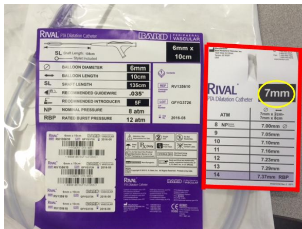
Ilustracja 1 – Nieprawidłowa etykieta

Poprawna karta zgodności dla rozmiaru 6 mm powinna zawierać następujące informacje dotyczące ciśnienia i średnicy zewnętrznej.