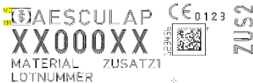
Rysunek 1: Identyfikacja daty wytworzenia zamieszczonej na powierzchni instrumentu