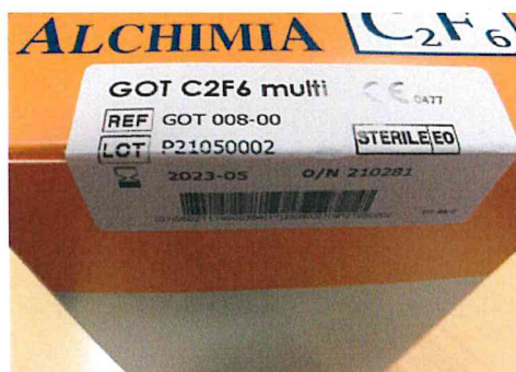
Rysunek nr 3

Zdjęcie cylindra gazu, umieszczonego na tacce blistrowej, należącego do partii P210500002 wyrobu GOT 008-00 (tył)