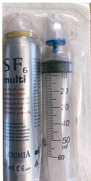
Rysunek nr 1

Zdjęcie cylindra gazu, umieszczonego na tacce blistrowej, należącego do partii P210500002 wyrobu GOT 008-00 (front)