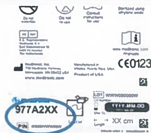
Rysunek 3: Etykieta wskazująca numer PIN