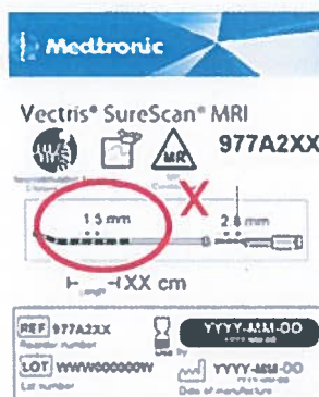
Rysunek 1: Etykieta z informacją o nieprawidłowych odstępach